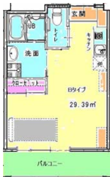
Bタイプ (8戸) 【浴室付き】 65,000円