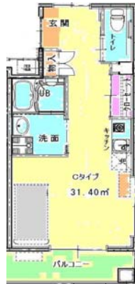
Cタイプ (4戸) 【浴室付き】 67,000円