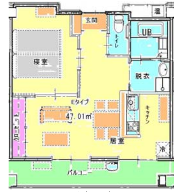
Eタイプ (4戸) 【1LDK 浴室付き】 80,000円