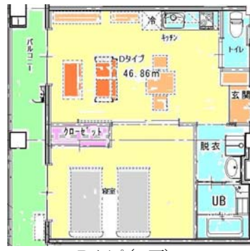
Dタイプ (4戸) 【1LDK 浴室付き】 80,000円